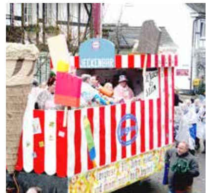
32 Karnevalssession 2026