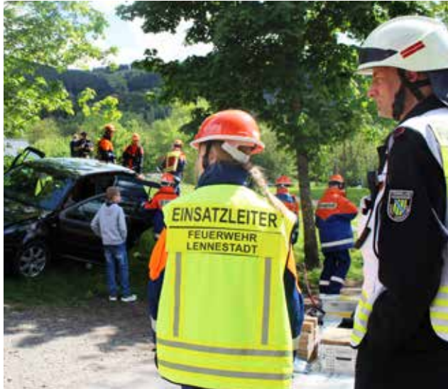
Hilfe beim Verkehrsunfall