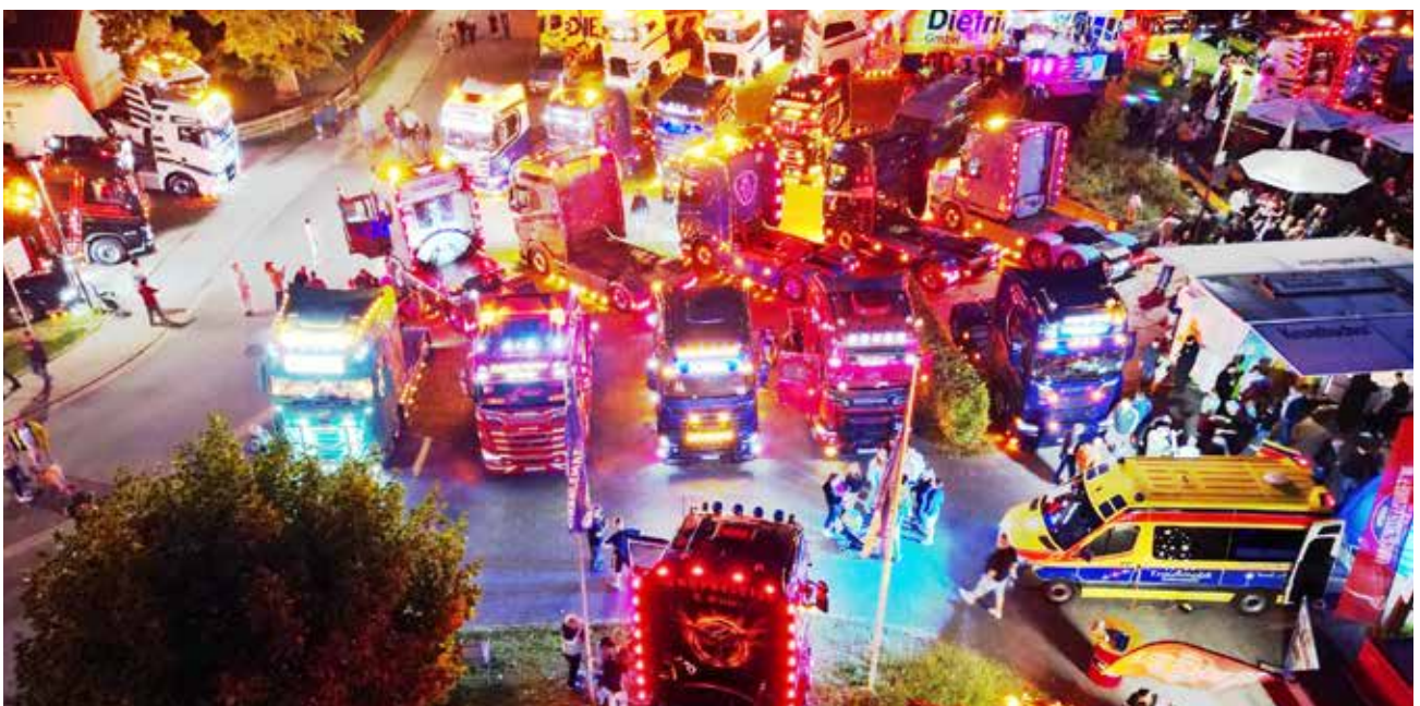
Spektakulär: Die beleuchteten Trucks in der Dunkelheit

Auch in diesem Jahr wird wieder ein großer Teil der Einnahmen an die Hilfsorganisationen Lächelwerk e. V. Schmallenberg und Strahlemännchen (Herzenswünsche erfüllen für schwer erkrankte Kinder) gespendet. An diesem Wochenende kann die Küche zu Hause kalt bleiben – die Besucher werden vor Ort verköstigt – sozusagen: Essen und Trinken für einen guten Zweck.