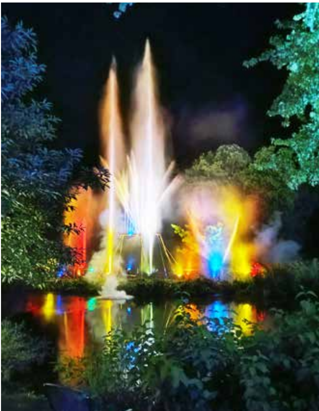
Wie früher: Wasserspiele mit Musik

Die Meinungen diesbezüglich gingen teilweise weit auseinander. Abschließend ließ sich die Frage – zumindest mit Sicht auf die nächsten Jahre – nicht beantworten. Für 2026 waren sich jedoch alle einig: Eine erneute kurzfristige Absage aufgrund möglicher Regelungen in Bezug auf die afrikanische Schweinepest und die damit verbundenen Risiken würden das endgültige Aus für Stark im Park bedeuten – für immer. Und das will niemand.