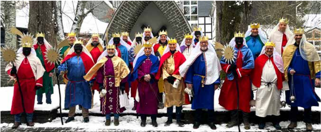
Die „Königs-Teams“ 2026

Der Tag begann mit einem gemeinsamen Frühstück ab 9 Uhr. Danach wurde geschminkt und in die königliche Rolle geschlüpft. Der Start erfolgte gegen 10 Uhr. Durch die gute Aufteilung der „Königs-Teams“ konnten im Laufe des Tages so viele Haushalte, wie möglich, besucht werden.