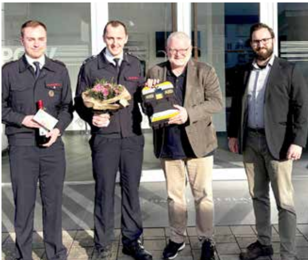
Die feierliche Übergabe.

Die Feuerwehr Saalhausen bedankt sich herzlich für die Spende und wünscht allen, dass der neue Lebensretter möglichst nie zum Einsatz kommen muss – und im Ernstfall schnell und zuverlässig helfen kann.