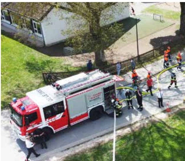
Übungsgelände der Jugendfeuerwehr Saalhausen