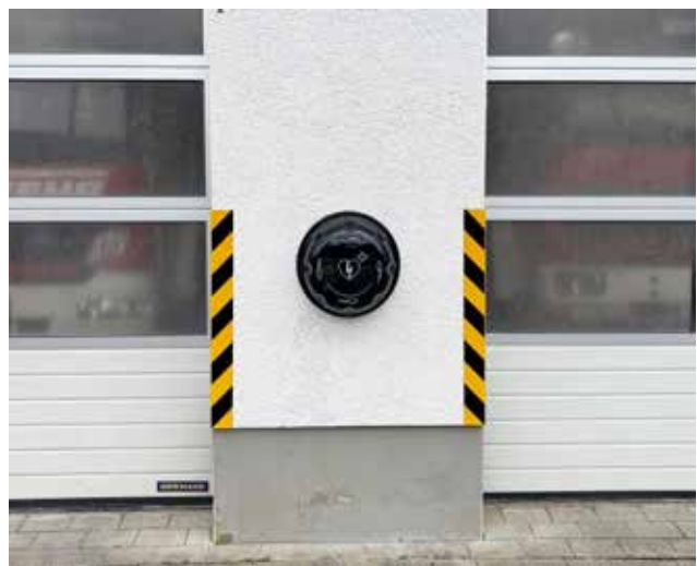
Defibrillator am Feuerwehrgerätehaus