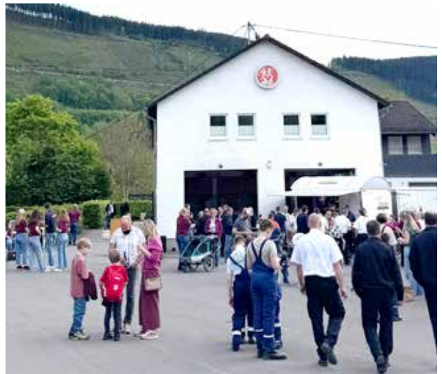
Alles im Griff - es konnte gefeiert werden